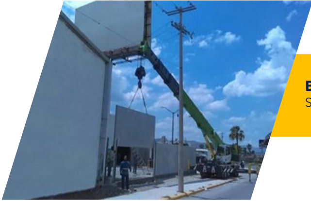
BARDA AGENCIA DE AUTOMÓVILES SALTILLO COAHUILA