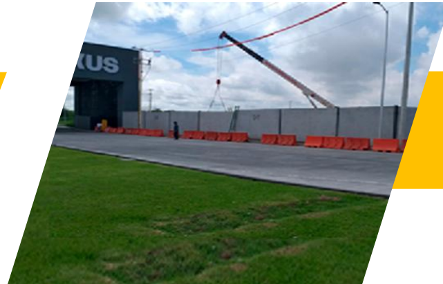
BARDA PARQUE IND. NEXXUS APODACA, N.L.