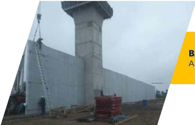
BARDA ESPECIAL PENAL APODACA APODACA, N.L.