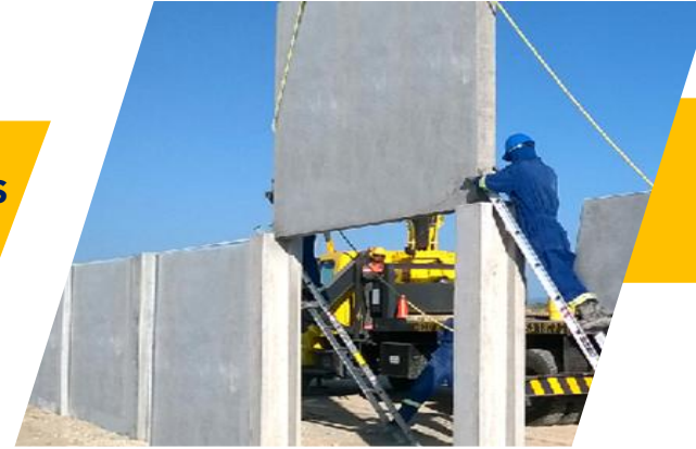
BARDA BLINDADA SUB ESTACIÓN DE GAS LOS RAMONES, N.L.