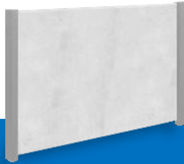
COLUMNA DE ACERO